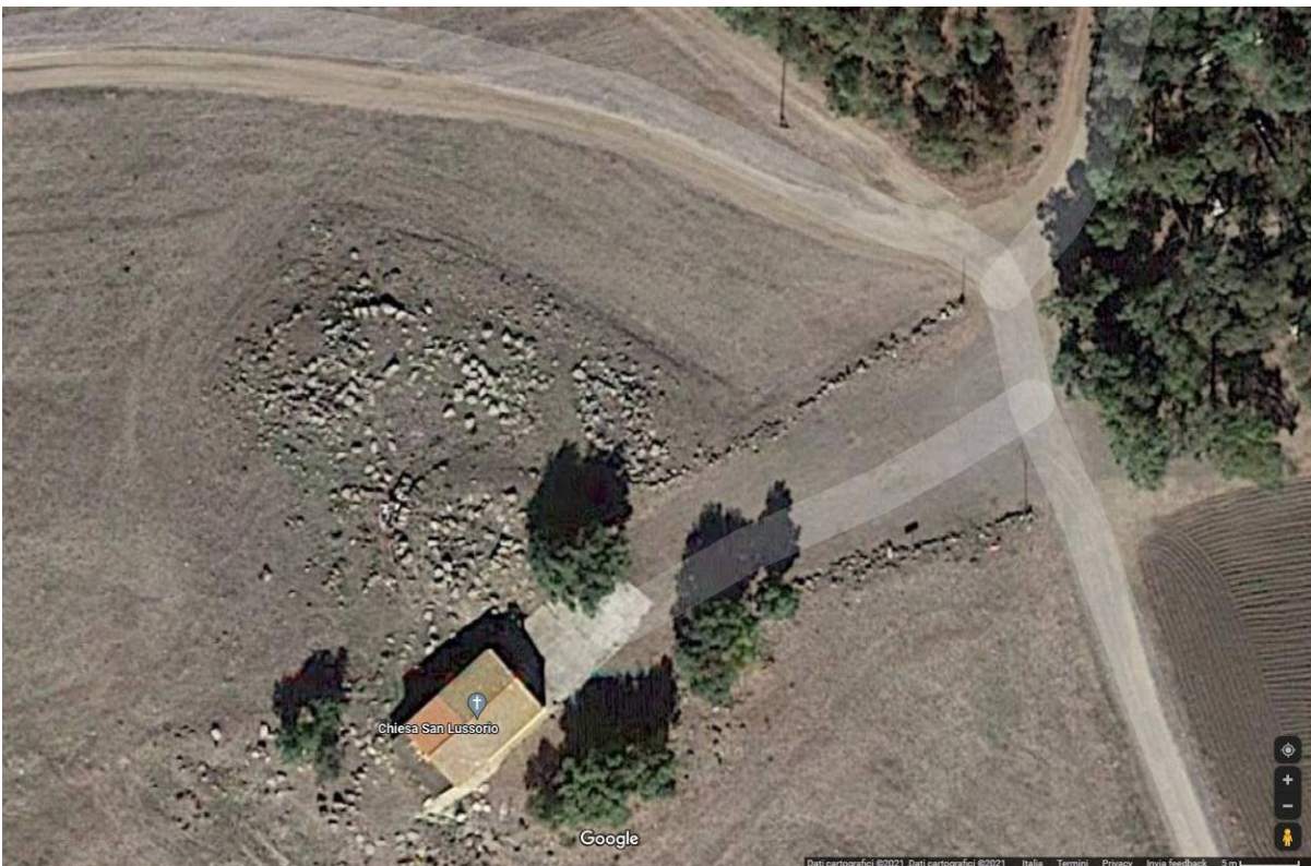
Pabillonis, Complesso Nuragico S. Lussorio